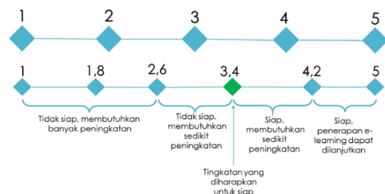
Gambar 1. Skala Pengukuran Tingkat Kesiapan E-Learning

Kuesioner yang telah dibuat disebarakan melalui media google form . Pengolahan data yang dilakukan dengan mengelompokkan data kuesioner yang telah didapatkan sesuai dengan variabel penelitian. Skala yang digunakan dalam mengukur tingkat kesiapan adalah skala likert (1-5). Sedangkan, untuk penentuan tingkat kesiapan mengikuti model Aydin dan Tasci [4] dengan 4 interval penilaian, yaitu tidak siap, membutuhkan banyak peningkatan (indeks 1-2,59); tidak siap, membutuhkan sedikit peningkatan (indeks 2,6-3,39); siap, membutuhkan sedikit peningkatan (indeks 3,4-4,19); siap, penerapan e-learning dapat dilanjutkan (indeks 4,2-5). seperti yang dapat dilihat pada gambar 1.