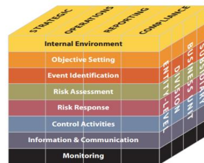
Gambar 1. Keterkaitan Sasaran, Komponen ERM, Unit Kerja

Pada penelitian ini, COSO ERM Integrated Framework digunakan untuk memberikan panduan pada Sekolah Tinggi Teknologi XYZ. Dengan COSO ERM Integrated Framework , peneliti dapat memasukkan data wawancara ke dalam suatu format tabel yang sesuai dengan alur pada komponen COSO ERM yang dapat dilihat pada gambar 1.